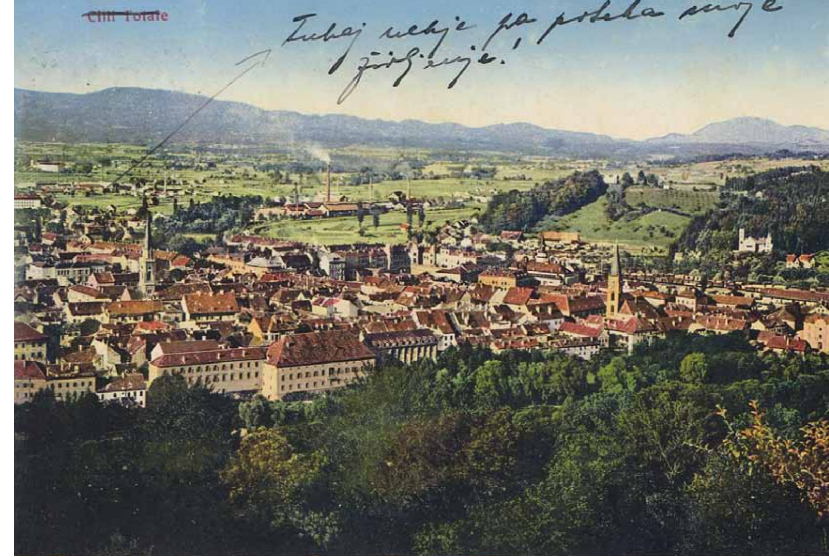
Postkarte mit Ansicht von Celje | Cilli | Razglednica s pogledom na Celje, 1914, © NUK.