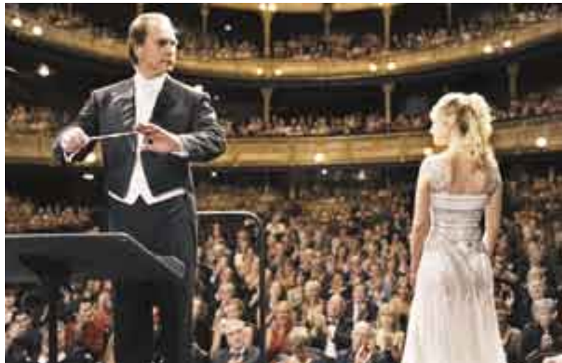
Tragikomično zamešani Koncert pod taktirko odličnega tandema magične Melanije Laurent in resnobnega Alekseja Guskova

Mednarodna tragikomična glasbena drama Koncert o političnem uničevanju karier in življenj umetnikov ter njihovem duhovitem kljubovanju in preseganju take usode