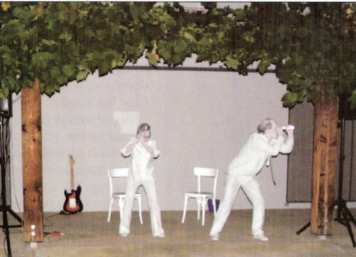
Vizualni del Prostorskih odmevov smo spremljali v prijetnem jesenskem večeru pred razstavno dvorano Pavlove hiše

iskanja. Čas potem poskrbi za preživetje tistega, kar prinaša